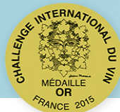
CHALLENGE INTERNATIONAL DU VIN 2015