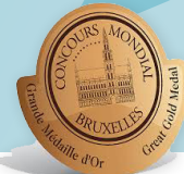
CONCOURS MONDIAL DE BRUXELLES 2015