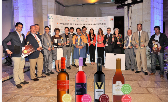
Melhores do Concurso

Organizado anualmente pela Comissão Vitivinícola Regional da Península de Setúbal (CVRPS), a edição de 2015 do Concurso de Vinhos da Península de Setúbal recebeu 128 amostras para prova, de onde resultaram 39 medalhas de ouro – 23 medalhas para vinhos com IG Península de Setúbal, 11 para Vinhos com DO Palmela e 5 para vinhos DO Setúbal. Das medalhas de ouro emergiram ainda cinco distinções de Melhor Vinho a concurso nas categorias Branco, Rosado, Tinto, Generoso e Melhor Vinho – o mais pontuado. Os vencedores foram revelados, dia 14 de Maio, numa cerimónia de entrega de prémios na Igreja de Santiago, no Castelo de Palmela.